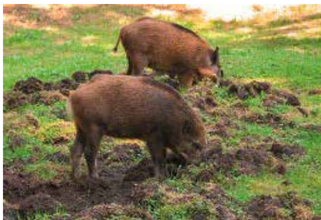
Vous aurez reconnu le sanglier.