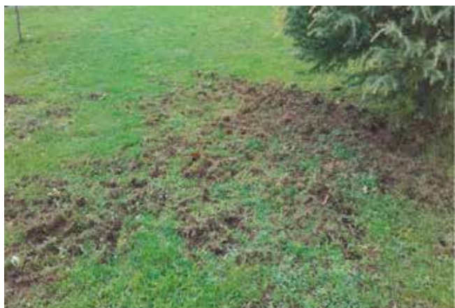
Dégâts fait par le blaireau

Sachez qu'un imprimé est mis à votre disposition pour déclarer ces dommages sur le site internet de la Mairie. Cet imprimé est à adresser au bureau de la société de chasse d'Aubazine via la Mairie d'Aubazine. Pour le cas des cultures, la FDC 19 et la société de chasse d'Aubazine peuvent prendre à leur charge une indemnité de réparation (modalités à voir sur le site de la FDC 19). Pour plus de renseignements, n'hésitez pas à prendre contact avec le bureau de la société de chasse d'Aubazine.