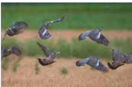
Palombes (ou pigeons ramiers)