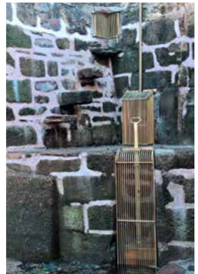
Les trois nouvelles vannes du vivier

Le Bourg 19190 Aubazine asabbau19190@gmail.com