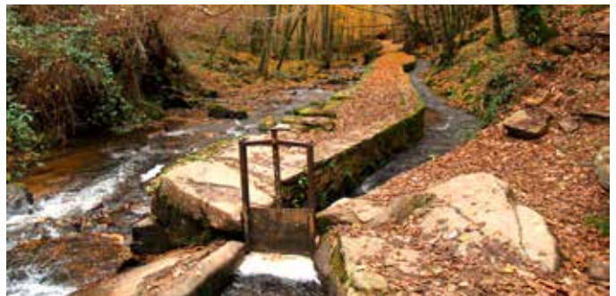
L'association Les Amis du Canal des Moines (LACAM) a été créée le 10 décembre 2022.

A ce jour, LACAM compte 32 adhérents. Pour tous renseignements si vous souhaitez faire partie de cette nouvelle association (20 € par personne et 30 € pour un couple), merci d'envoyer votre demande aux coordonnées ci-contre :